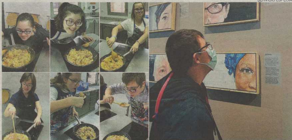
Varios de los alumnos/trabajadores de los proyectos "Cultura inclusiva" y "Llaves para la autonomía".

Los alumnos/trabajadores de Cultura Inclusiva seguirán un itinerario formativo que les permitirá obtener el certificado de profesionalidad en "operaciones auxiliares de