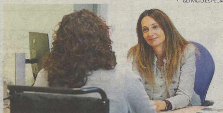
Una trabajadora social atiende a una usuaria en Dfa.